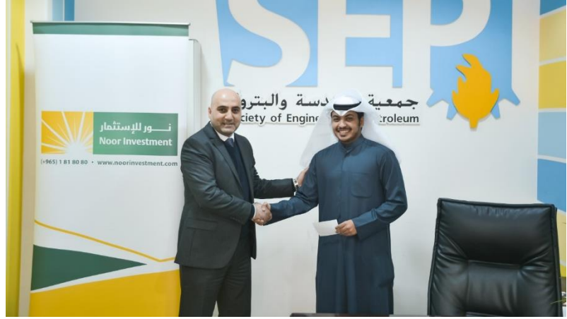
صورة لممثل شركة نور للاستثمار أثناء تقديم الدعم لرئيس جمعية الهندسة والبتترول في جامعة الكويت